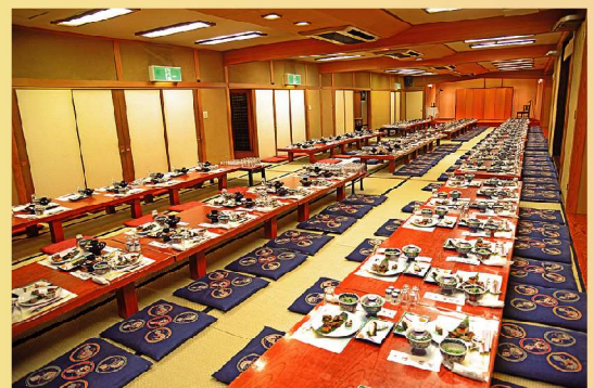
お食事会場は最大100畳。180名様までご収容できます